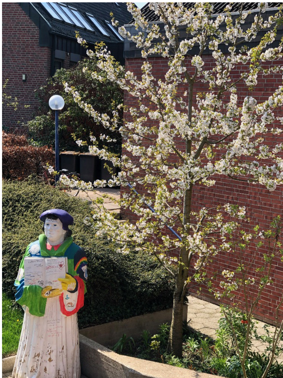
Nach ihrem "Ausflug" (s. Seite 4, 7 und 8) hat die Luther-Statue nun einen neuen und sicheren Platz im Innenhof zwischen Gemeindezentrum und Michaelshaus unter dem blühenden Kirschbaum gefunden.