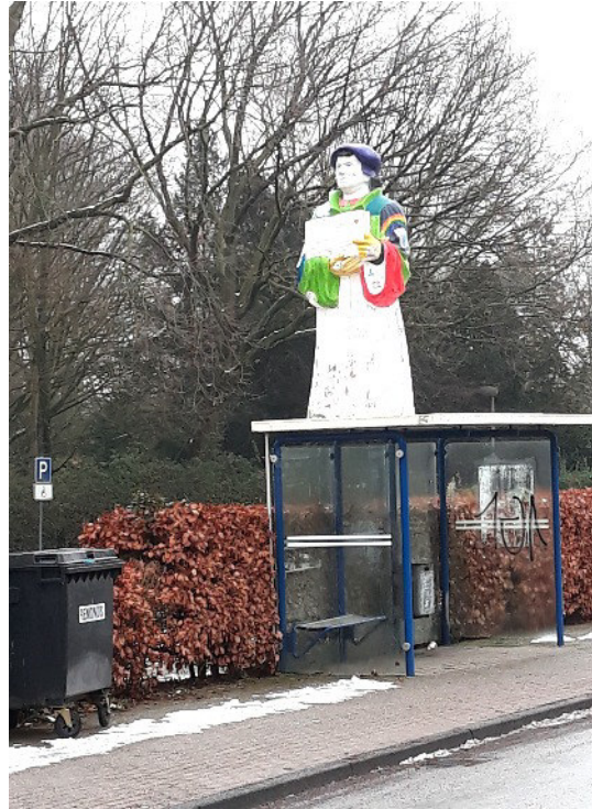
Tatsächlich: Luther steht auf dem Wartehäuschen. Wie ist er da hoch gekommen?

lichst dieses ausgearbeitete Konzept übernimmt. Das würde allen Seiten viel Planungszeit und damit auch Geld ersparen. Einen ersten Kontakt hat es gegeben, der recht vielversprechend ist.