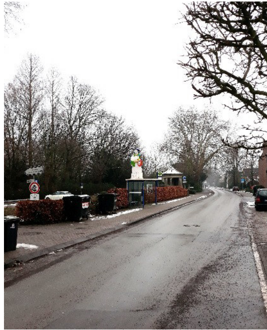
Kann das sein? Die Luther-Figur auf dem Warthäuschen gegenüber der Kirche??

Die Einführung des neuen Presbyteriums wird sein am Sonntag, dem 29. März 2020, um 11:00 Uhr in Havixbeck. Informationen zum Presbyteramt bzw. zur Wahl erhalten Sie gerne bei Pfarrer Oliver Kösters.